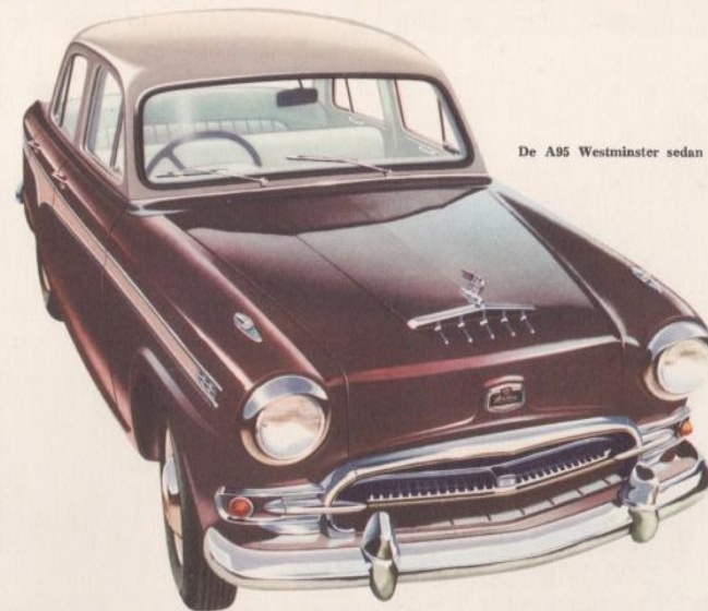
De A95 Westminster sedan