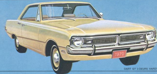
DART GT 2-DEURS HARDTOP

De sportieve Dart GT, uitgerust met een 6-cilinder of een 8-in-V, is zo fraai en heeft zoveel pit dat hij ook de moeilijkste bestuurder geestdriftig maakt. Wenst U een compacte auto, die soepel stuurt en vlot manoeuvreert en die tevens het prestige en - wat belangrijker is - de prestaties uit de topklasse bereikt, dan is de Dart 1970 voor U de gedroomde wagen.