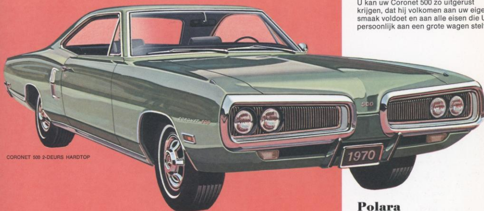
CORONET 500 2-DEURS HARDTOP