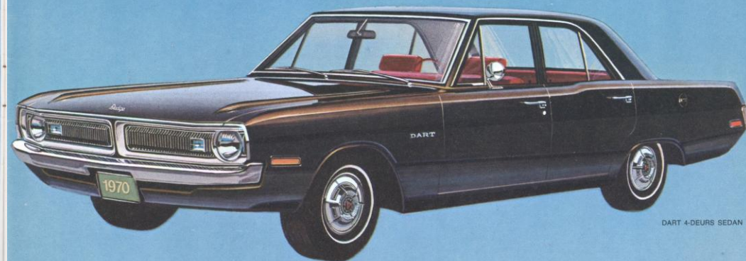
DART 4-DEURS SEDAN