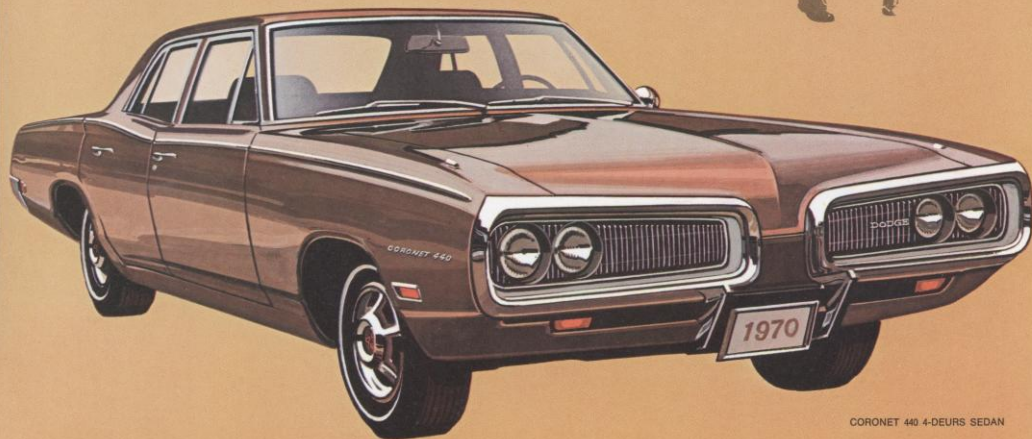
CORONET 440 4-DEURS SEDAN