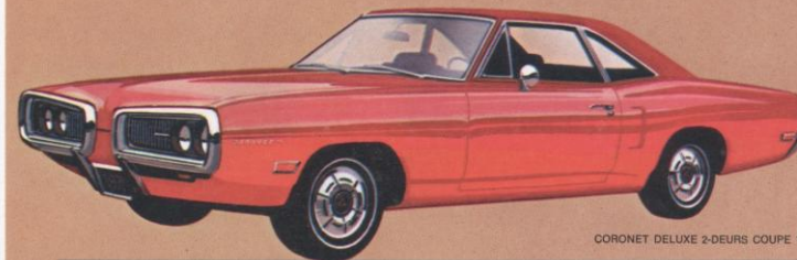
CORONET DELUXE 2-DEURS COUPE *

Bij de Coronet blijken typische kwaliteiten en luxe uit iedere centimeter. Echt Dodge van voor- tot achtersteven! In de Benelux enkel leverbaar op speciale bestelling.