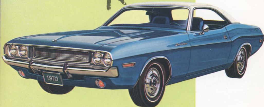
CHALLENGER 2-DEURS HARDTOP

Een Gran Turismo wagen... op grandioze manier gepresenteerd. Een grote keuze van motoren... van de zuinige, maar krachtige, schuin gemonteerde 6-cilinder tot de snelheid en het vermogen van een 8-in-V van 5,2 liter. Twee carrosseriemodellen : een convertible en een hardtop.