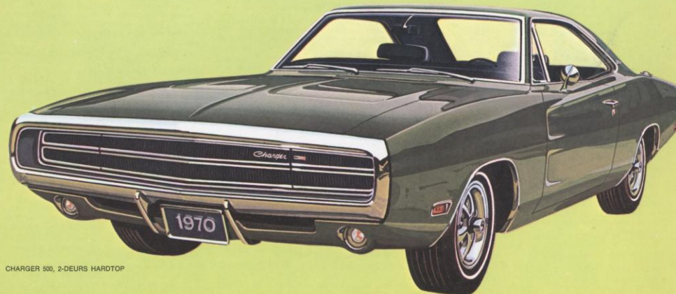
CHARGER 500, 2-DEURS HARDTOP

De fabelachtige Charger 500 is een grote sportwagen, waarin ruim plaats voor 5 passagiers. Het is echter in de eerste plaats een sportieve wagen, van een unieke vormschoonheid, met een lange, gestrekte motorkap en elegante lijnen, in een stijl die zowel de lengte als de breedte aksentueert ! Van een schoonheid die indruk maakt en met een vermogen dat even impressionant is : de Charger 500 is uitgerust met een 8-in-V motor van 5,2 liter.