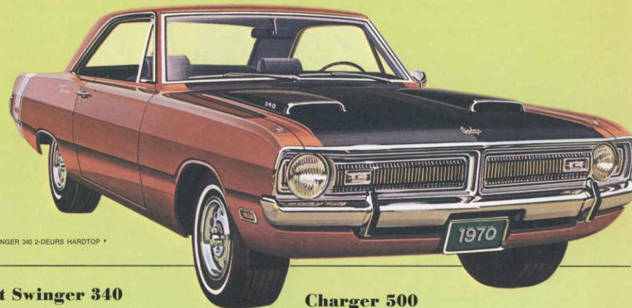
DART SWINGER 340 2-DEURS HARDTOP *