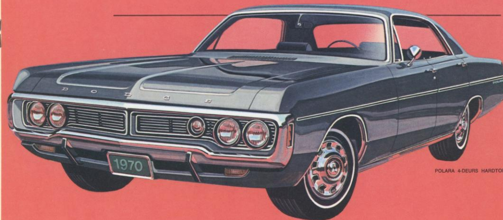
POLARA 4-DEURS HARDTOP

Polara en Monaco . . . De grootste en meest luxueuze van alle Dodge wagens . . . magnifieke voorbeelden van automobiel-estetiek . . . Wil U het beste dat de automarkt van heden te bieden heeft, kies dan een Polara of een Monaco.