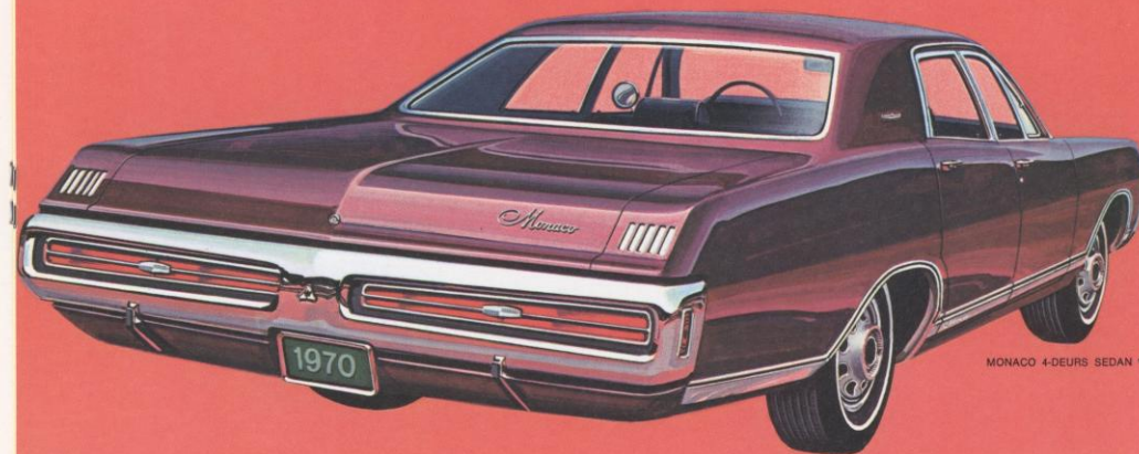
MONACO 4-DEURS SEDAN *