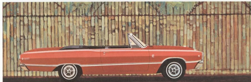
DART GT CONVERTIBLE

De Dart is een streng uitgeteste wagen, van bumper tot bumper. Op de 67 km lange testbanen van de Chrysler Corporation te Detroit worden de proef-Darts aan de zwaarste en ongewoonste testen onderworpen. Op 1 Jaar tijd worden hier op deze ultrasnelle testbanen met 6 rijstroken en hellingen van 32 1/2, meer dan 11 miljoen km afgelegd door de Chrysler-testpiloten. Hun taak: trachten de Dart stuk te rijden! Makkelijk, denkt u? Gewoon onbegonnen werk! De Dart is immers het resultaat van een reeks keiharde en tot het uiterste doorgedreven tests. Ieder onderdeelje van uw Dart is getest en gekeurd, eerst in de laboratoria, daarna op de weg en dan opnieuw nagezien in de garage. Gespecialiseerde ingenieurs en technici enerzijds en geperfectionneerd elektronisch materieel anderzijds staan borg voor de lange levensduur van uw Dart!