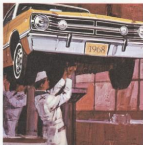
DART GTS 2-DEURS HARDTOP

De volbloed Dart GTS (onderaan): een droomwagen waar de kracht uitstraalt! Met een snedige 5.6 liter motor van 275 onstuimige PK. Vier-vakscarburator. Dubbele uitlaat. Vermogen te kust en te keur. Geweldig!