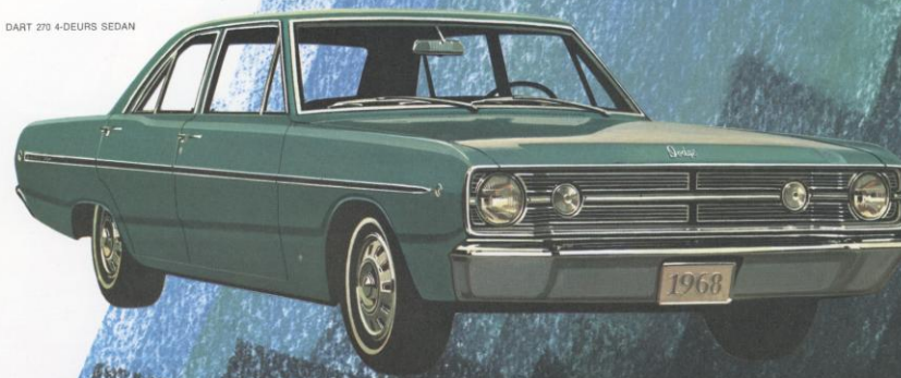
DART 270 4-DEURS SEDAN

De prestigieuze Dart 270 4-deurs sedan : de ideale combinatie van een rijke klasse-sedan en een pittige prestatie-auto. Op en top Amerikaans comfort en stijl. Op en top Europese zuinigheid en rijkwaliteiten ! De Dart 270 is geheel afgestemd op zorgeloos en veilig rijden. Heerlijk zo'n wagen te besturen !