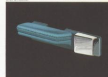
Speciaal ontworpen en sterk verbeterde porfiertrikken voor het filteren van de benzine. Het voorkomt dat de benzine door de benzine naar de cilinders stroomt. Dit helpt alleen een langere levensduur, maar voor de auto veiligheid.