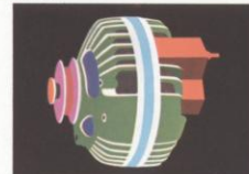
De verbeterde, vliezige licht-afnamer levert de batterij zelfs wanneer de motor stiltoeren draait, zorgt voor de batterij langer meegeen en vergemakkelijkt het starten bij koud weer.