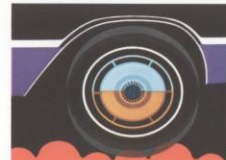
De Torque Aire schakeling geeft betere handleikbaarheid ongeacht het wegdek en de belasting. Zij bestaat uit torsiestangen en kogelgewrichten vóór en -half-eilijckre bladveren achteraan, gekoppeld met de bekende Drive shaft-achtersas op de 4-deurs. De hele schakeling is met rubberveren gebouwd.