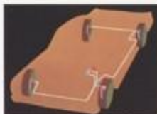
De motor, de versnellingsbak en de achteras zijn afgedemd op afzonderlijke hydraulische stutten van de voor- en achteras. Het voor- en achteras is afgedemd op afzonderlijke hydraulische stutten van de voor- en achteras.