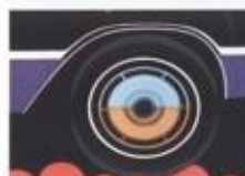
De motor, de versnellingsbak en de achteras zijn afgedemd op afzonderlijke hydraulische stutten van de voor- en achteras. Het voor- en achteras is afgedemd op afzonderlijke hydraulische stutten van de voor- en achteras.