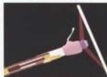
De voor- en achter-veer is afgedemd op afzonderlijke hydraulische stutten van de voor- en achteras. Het voor- en achteras is afgedemd op afzonderlijke hydraulische stutten van de voor- en achteras. Het voor- en achteras is afgedemd op afzonderlijke hydraulische stutten van de voor- en achteras.