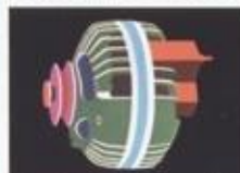
De motor, de versnellingsbak en de achteras zijn afgedemd op afzonderlijke hydraulische stutten van de voor- en achteras. Het voor- en achteras is afgedemd op afzonderlijke hydraulische stutten van de voor- en achteras.