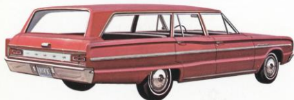
DODGE CORONET 440 4-DEURS STATION WAGON

Voor 1966 brengt Dodge Coronet een volledig nieuwe reeks wagens. De Coronet 440 en de Coronet De Luxe werden uitgedacht en gebouwd voor de man die «klasse» wil. Ondanks hun zeer persoonlijke stijl en compleet nieuwe vormgeving, blijven het toch «ware» Dodge-wagens en dit in de zo vertrouwde zin van het woord.