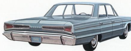
DODGE POLARA 4-DEURS SEDAN

De ruime Dodge Polara station wagens bieden een overschot aan plaats voor passagiers en bagage. Ze zijn leverbaar met 2 zitbanken (voor 6 personen) of met 3 zitbanken (voor 9 personen). De derde zit staat dan naar achter gekeerd. Andere nieuwe Polara modellen (hier niet afgebeeld) zijn: 2-deurs hardtop en cabriolet. Beide hebben een volledig-vinyl binnenbekleding en drie zitplaatsen vóór en achter. Als U gesteld is op individuele kuipzetels vooraan met een sierlijke console tussenin, kies dan de verrukkelijke Polara 500 in 2-deurs hardtop- of cabriolet-uitvoering. Een overzicht van de verschillende Polara modellen vindt U op pag. 9 en 10.