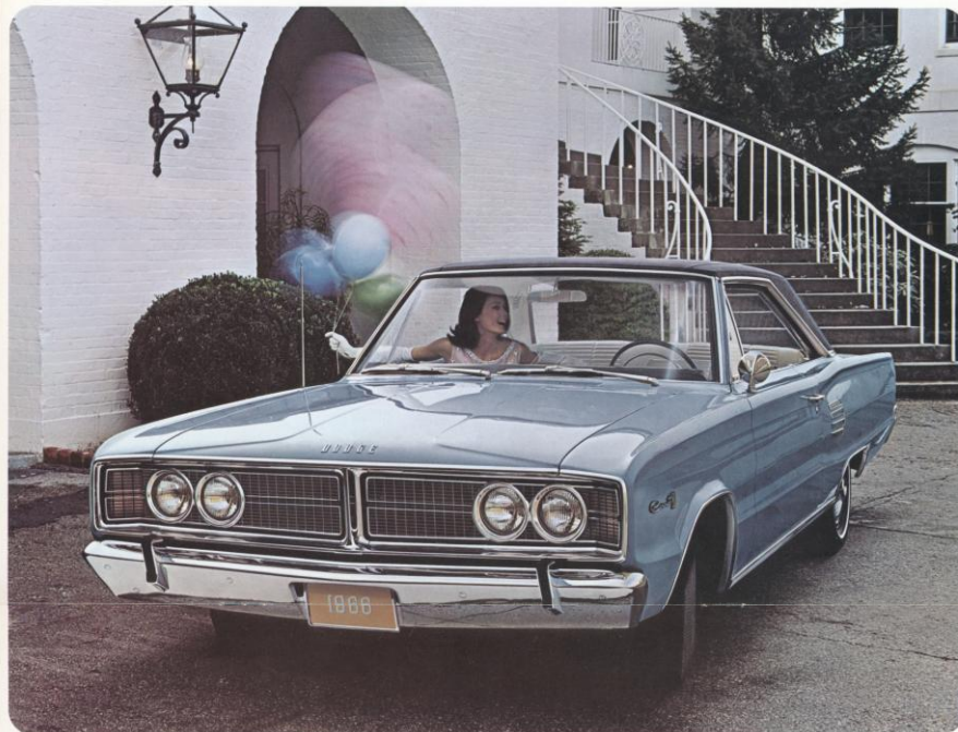
DODGE CORONET 500 2-DEURS HARDTOP

Neem gelijke delen luxe, stijl, prestatievermogen en rijgenot en U bekomt: de gloednieuwe Dodge Coronet 500 voor 1966. De jonge vivante lijn van het koetswerk samen met de nieuwe luxueuse binnenatwerking maken van de Coronet 500 een toonbeeld van jeugdige charme en rijk comfort.