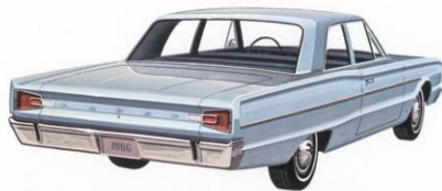
DODGE CORONET DE LUXE 2-DEURS SEDAN