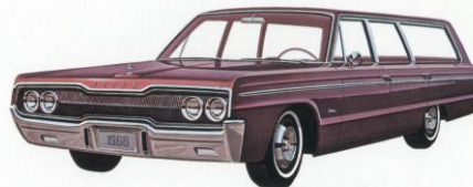
DODGE POLARA STATION WAGEN