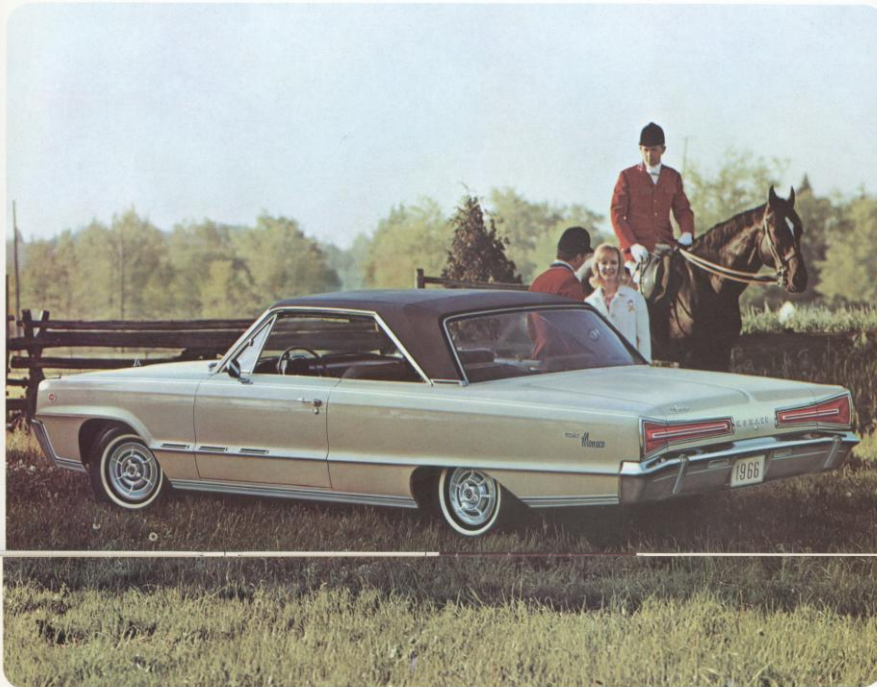
DODGE MONACO 2-DEURS HARDTOP

Op kop van de gehele Dodge gamma voor 1966 prijkt de plektijne luxueus opgevatte Monaco. De typische Dodge Monaco-stijl vindt U terug in de imposante en mooi bewerkte radiatorgrille evenals in de origineel uitgewerkte achterlichten. Het meest representatieve van de vijf Monaco modellen voor 1966 wordt hierboven getoond: de elegante, standingvolle Dodge Monaco 500. De Monaco 500 is een 4-persoons 2-deurs hardtop en dit in de meest grootse en ruimste betekenis van het woord. Hij biedt comfortabele kuipzetels vooraan, waartussen de gerieflijke console. Interieurbekleding naar keuze volledig uit weelderig vinyl of uit een combinatie van vinyl en speciaal weefsel.