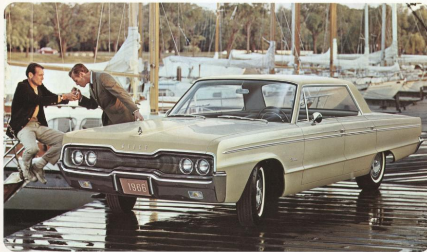
DODGE POLARA 4-DEURS HARDTOP

De nieuwe elegante Dodge Polara modellen vallen op door hun typisch eigen stijl, waarin luxueuze afwerking en aantrekkelijke vormgeving bijzonder fijn aan bod komen. Extra's als zetels met schuimbervoering, volledig met tapijt beklede vloer en een altijd-ja-knikkende V-8 krachtmotor, zijn hier standaarduitrusting. De nieuwe Polara 4-deurs hardtop, die U hierboven afgebeeld ziet, is één van de zeven ruime Dodge Polara modellen voor 1966, alle gebouwd op de 307 cm lange wielbasis.