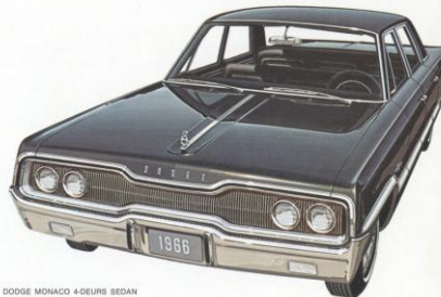
DODGE MONACO 4-DEURS SEDAN

Wie gesteld is op nog meer kracht, zal zijn keuze vinden in de zware V-8 motoren, leverbaar op alle Monaco modellen. Raadpleeg hiervoor het overzicht van de Monaco modellen op pag. 9-10 en de technische kenmerken op de achteromslag.