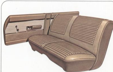
INTERIEUR DODGE CORONET 440 4-DEURS SEDAN (GEHEEL VINYL)

In de nieuwe gamma Coronet-modellen (op volgende pagina afgebeeld) vindt U sedans, hardtops, cabriolets en een reeks station wagens, die in hun klasse beslist als de meest veelzijdige en gerieflijke kunnen doorgaan. Dodge Coronet, de wagen met reusachtig prestatievermogen, buitengewone luxe en feilloos van lijn.