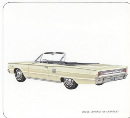
DODGE CORONET 500 CABRIOLET

Elke kilometer wordt een kilometer puur rijgenot met de nieuwe 1966 Dodge Coronet 500.