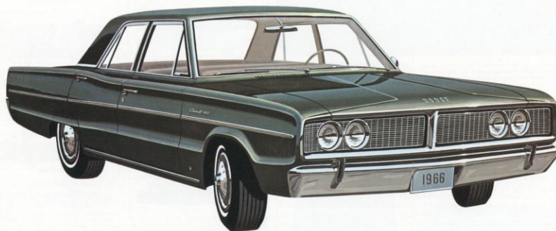
DODGE CORONET 440 4-DEURS SEDAN