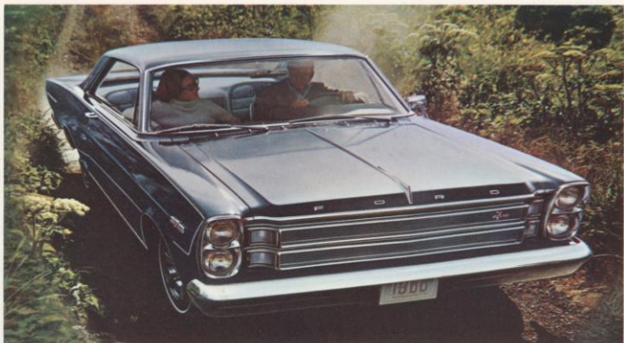
De geheel nieuwe „7-liter“ Hardtop.