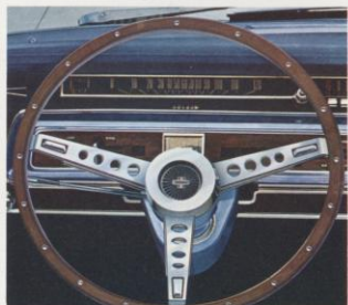
Imitatie notenhouten sportstuur.