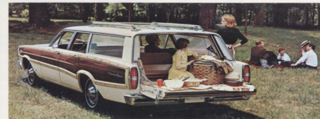
NU IS HET EEN LAADKLEP! Als u de laadvloer langer wilt hebben, om als laadvloer of voor lange lading te gebruiken (ladders, planken, oppervlakt tapijt) kunt u Ford's nieuwe „toverdeur” laten neerklappen, zodat u ruim 60 cm laadlengte wint. Alwis... zo'n unieke Ford-vondst die standaard is op alle '66 Ford Station Wagons.

Extra groot en ruim zijn deze Station Wagons: maar liefst 2,9 m 3 laadruimte, en daar gaat alles in, van lange ladders tot stapels houtplaten plat-op-de-vloer. De rijkwaliteit van de Ford Station Wagons kan het beste worden vergeleken met de Ford Sedan — dezelfde geruisloosheid, soepelheid, en gemakkelijke bestuurbaarheid. Er zijn nieuwe extra's leverbaar die net zo opwindend zijn als de 1966 Fords zelf. Nieuwe 345 pk Thunderbird 428 V-8 motor... bekrachtigde schijfremmen vóór... verstelbaar imperiaal... Stereo-sonic Tape systeem... en nog veel meer.