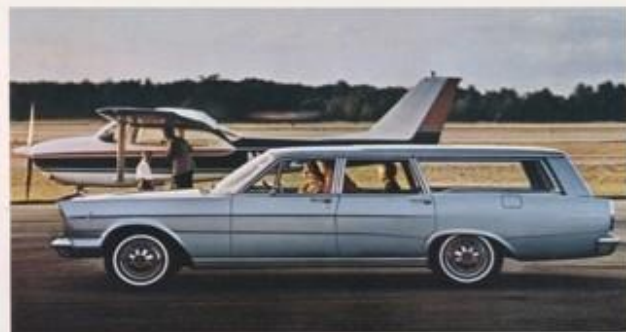
FORD COUNTRY SEDAN, EEN VAN DE VIJF FORD STATION WAGONS.

Sta deze bladzijde om en ontdek wat Ford u te bieden heeft voor 1966.