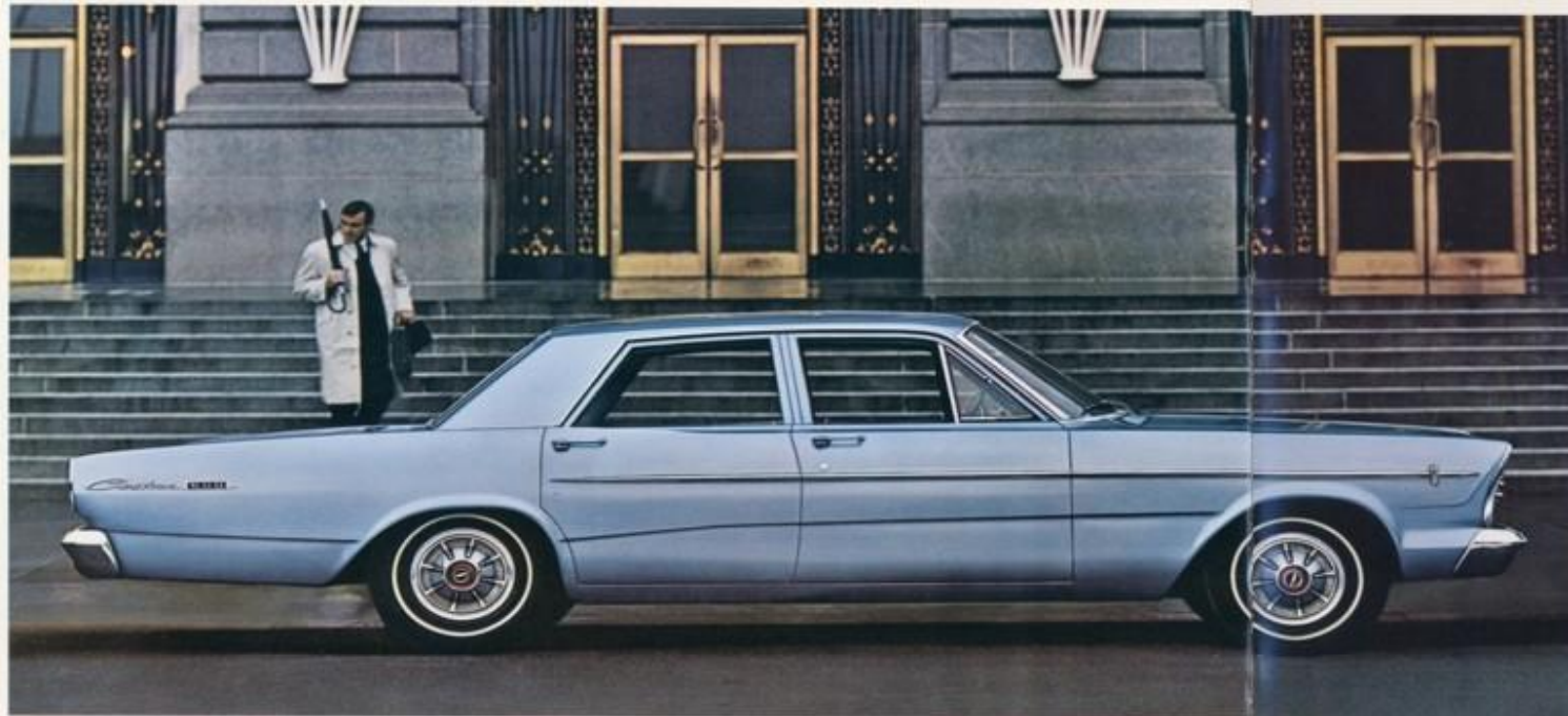
Custom 500 4-deurs sedan