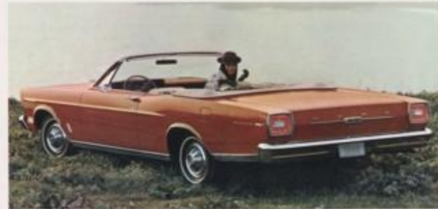
GALAXIE 900X CONVERTIBLE, EEN VAN DE DRIE FORD CONVERTIBLES.