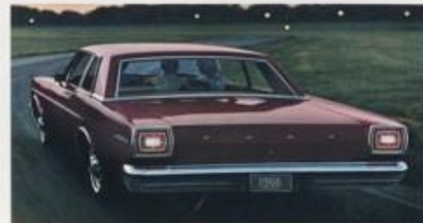
Custom 2-deurs sedan

Custom 2-deurs Sedan (links onder), de voorligste Ford 1966 met de meeste waarde voor uw geld. Deze wagen biedt u alle voordelen van de 1966 Ford..... grote interieurruimte (niet te vergeten een bagagekoffer van 8,24 m 3 inhoud), en veel comfort. Luxueus tapijt- en vloerbedekking, in kleur aansluitend met de interieurschema's (stof/kunstler) waaruit u een keuze kunt maken; bijpassende bekleding van plafond en zonnekleppen en nog tal van andere voorstellingen behoren allemaal tot de standaarduitrusting van de Custom.