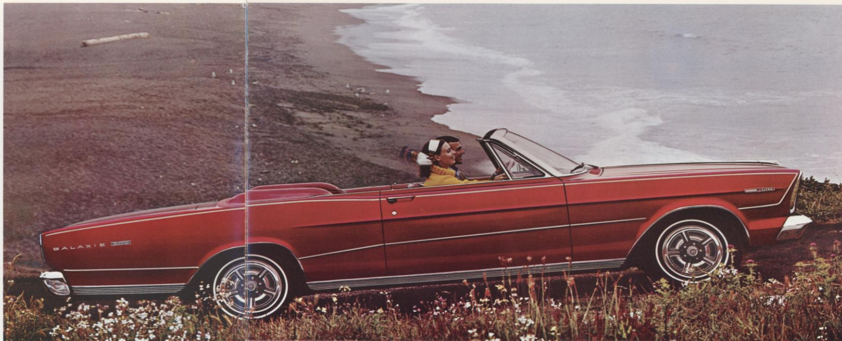
GALAXIE 500 „7-liter“ Convertible; ook leverbaar in de XL serie).