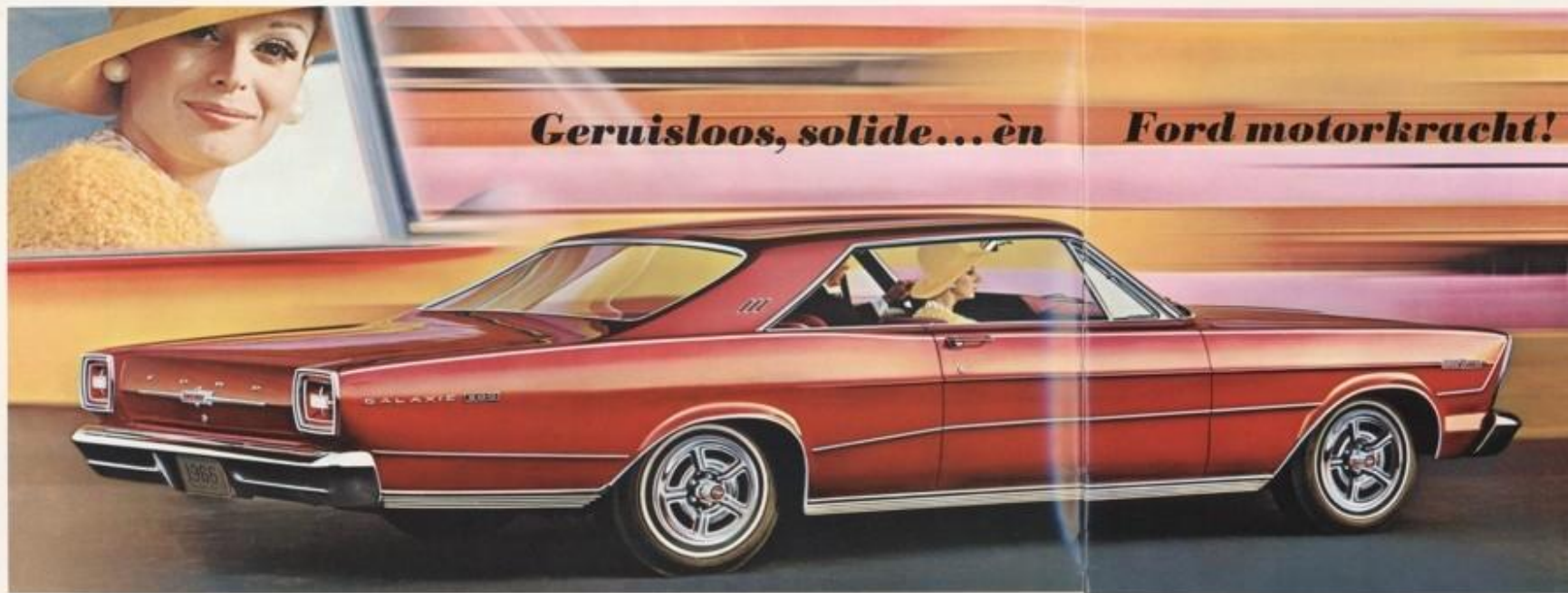
GALAXIE 900 7-LITER 3-DEURS HARDTOP, ZIJN MAAR EEN VAN DE VELE FORD MODELLEN.

Geruisloosheid is het kenmerk van de Ford 1966... van de door-en-door degelijkheid, die vooral tot uiting komt in de befaamde Ford rijkwaliteit. Soepel, vlot, gemakkelijk bestuurbaar... verblijvend geruisloos. Vele technische verbeteringen van Ford vormen het nieuws op autogebied voor 1966.