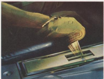
In het midden gemonteerd T-vormig pookje van de 3-speed Cruise-O-Matic vol-automatische transmissie is standaard.