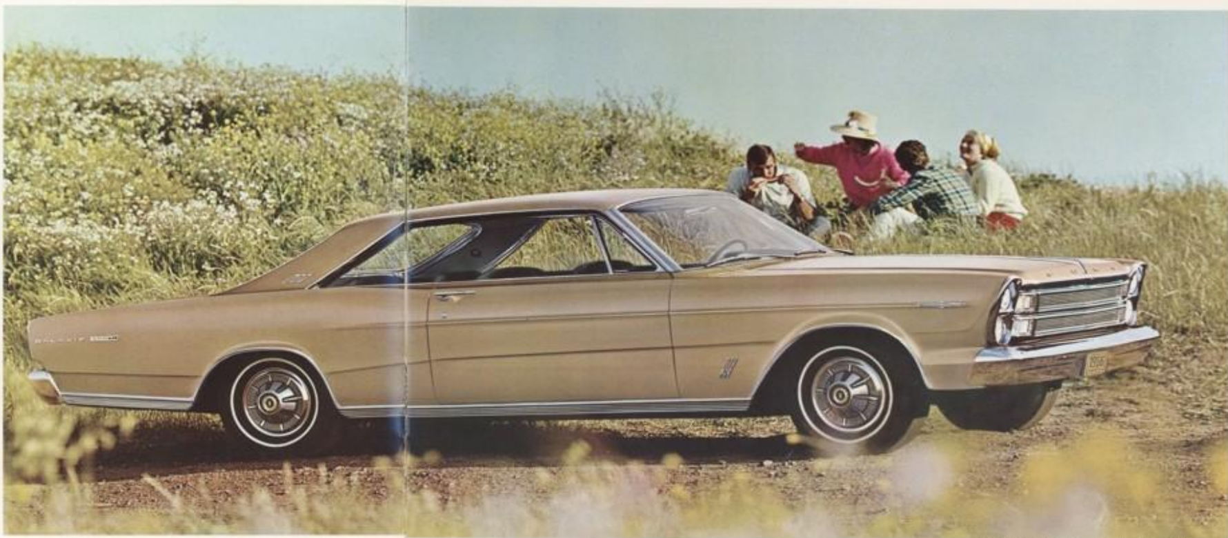
Galaxie 500/XL 2-deurs Hardtop, ook leverbaar in de 7-liter versie.

De nieuwe elegante daklijn en holgebogen achterruit accentueren de fraaie bouw van de XL Hardtop. De XL Convertible (zie pag. 2) heeft een 3 lagen dikke, extra duurzame kunstleren kap met een krasvrije, kleurbestendige achterruit van glas. Kap naar keuze in zwart, wit of blauw. Kies „extra” het Stereo-sonic Tape systeem... en u geniet van een totaal nieuwe, „natuurlijke” weergave. Kies de „SelectAir” Conditioner... en u bepaalt zelf het klimaat in uw auto. Kies uit één van de 6 Ford V-8 motoren (tot 425 pk)! De mogelijkheden om een XL aan n en uw manier van rijden aan te passen zijn onbegrensd!