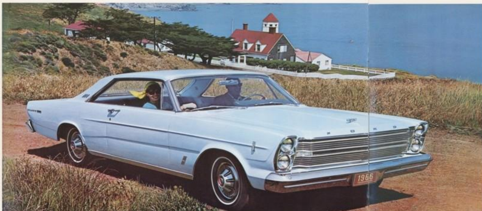
Galaxie 500 2-deurs Hardtop.