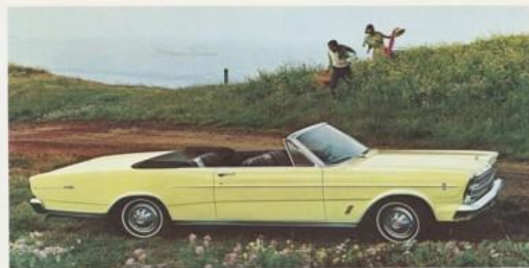
Galaxie 500 Convertible (boven)

U kunt aan dit alles nog vele exclusieve extra's toevoegen, zoals het interessante nieuwe Stereo-sonic Tape systeem! liefst vier luidsprekers bezorgen u een loge-plaats bij uw liefvelings-concert op de band.