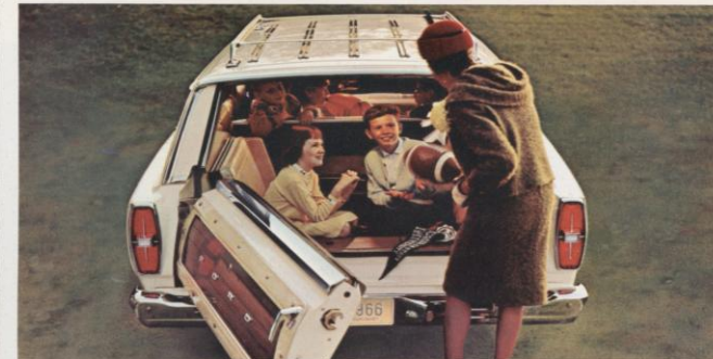
HIER IS HET EEN PORTIER! Ford's exclusieve „toverdeur” is de nieuwste vondst op stationwagengebied sinds jaren. Het is een vernuftige combinatie van portier en laadklep. Draai het handvat om en het portier zwaait opzij om uw passagiers gemakkelijk te laten instappen of uw lading vlot bereikbaar te maken. (Let ook op de aan weerskanten tegenover elkaar geplaatste en met één handbeweging inklapbare banken achterin).

die de zijwind ombuigen en zorgdragen voor een constante luchtstroom langs de buitenzijde van de achterraut, waardoor deze helder en schoon blijft. Alle modellen hebben gemakkelijke in- en opklapbare middenbanken. Alle modellen hebben met schuimrubber gevoerde banken... en bekledingen van duurzaam, gemakkelijk schoon te houden kunstleer... en voeren de soepele, sterke, en zuinige Ford Big Six motor gekoppeld aan de gemakkelijk schakelende volledig gesynchroneerde Synchro-Smooth versnellingsbak. Dat alles en nog veel meer is standaarduitrusting op alle '66 Ford Station Wagons.