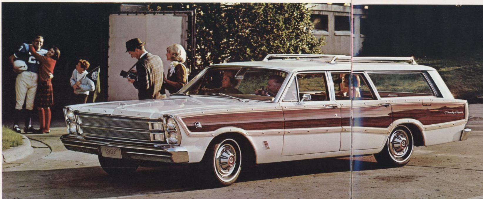
Ford Country Squire... een van de vijf grote Station Wagons voor 1966 (Country Sedan zie pag. 3).